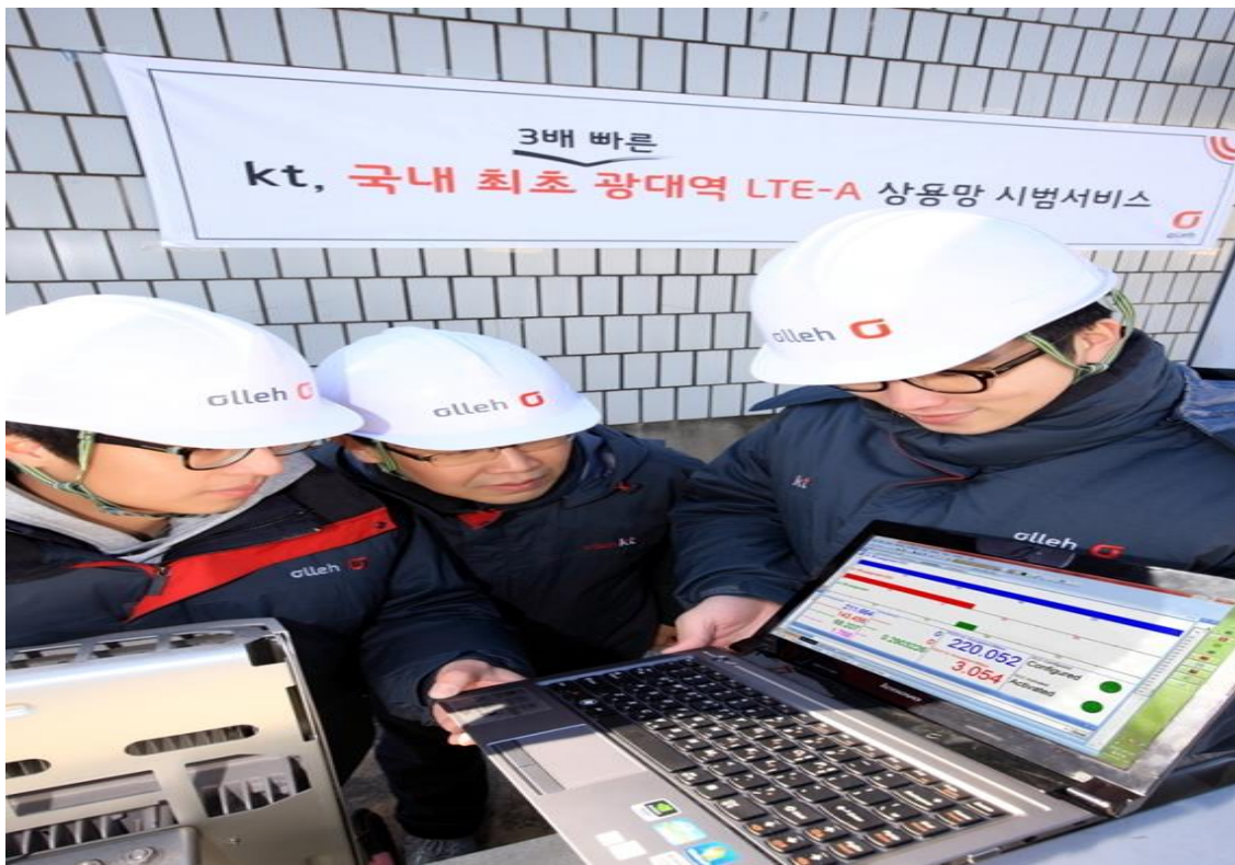
▲ 지난 1월 14일 강남 수서 및 일원지역 일대 기지국에서 실시한 속도테스트 현장