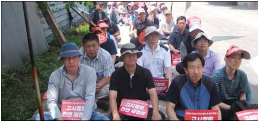
냉동창고 업체들이 '직원 단합대회' 명목으로 집회하고 선전

이와 더불어 사업장 별로 잔업 거부, 총회 등을 통해 오후 5시부터 서울 시청 앞 광장 등 지역별로 열리는 '국민 건강권 쟁취를 위한 민주노총 총파업 출정식'에 참가할 계획이다. 민주노총은 주말에도 '전국 동시다발 결의대회'를 잇따라 개최하고 촛불집회에 조직적으로 결합하겠다고 밝혔다. 민주노총은 "이명박 정부가 계속 독선을 고집한다면 그 수위를 점차 높여가겠다"고 덧붙였다.