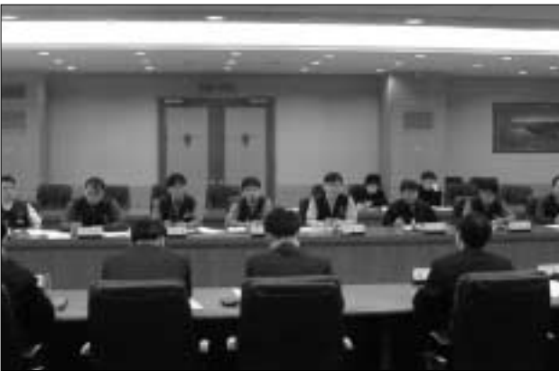
12일 사측이 전략상품선정을 위한 상품설명회를 열자 노동조합은 상품판매 대책기구 설립을 강력히 요구했다

또한, PCS 및 비즈메카는 전략적 상품에서 제외하기로 했으며 PCS는 지사별로 차등되는 보조금을 일원화하고 영업직 및 비영업직에 대한 판매보상금과 단말기 교체에