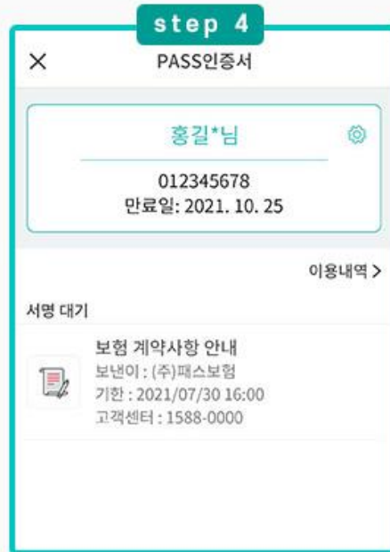
PASS 인증서 확인하기

※ PASS 앱이 미설치된 경우 구글플레이 / 원스토어 / 앱스토어에서 각 통신사 PASS 앱 다운로드 및 회원가입 후 이용해주세요.