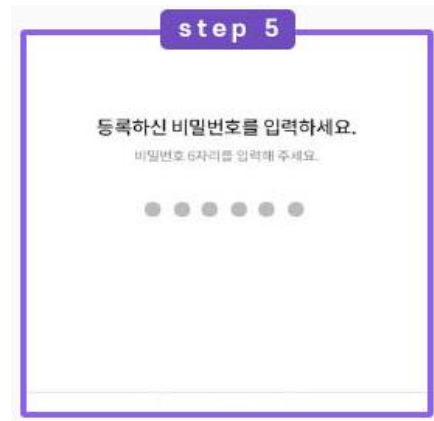
PASS 인증 암호 입력