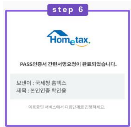
인증 완료 클릭

※ PASS 앱이 미설치된 경우 구글플레이 / 원스토어 / 앱스토어에서 각 통신사 PASS 앱 다운로드 및 회원가입 후 이용해주세요.