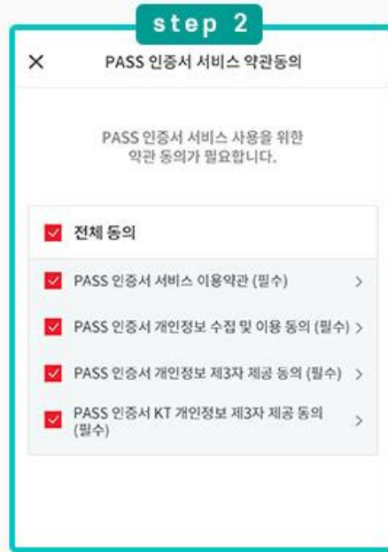
PASS 인증서 약관동의