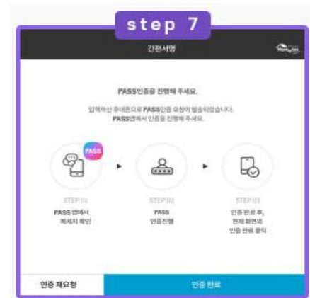
PASS 간편 서명 완료