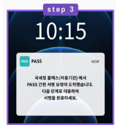
PASS 앱 PUSH 확인