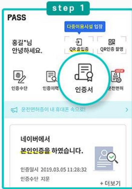
PASS 메인에서 인증서 클릭