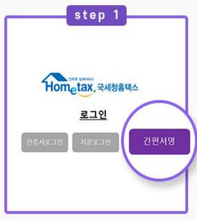
국세청 홈택스 로그인 간편서명 선택