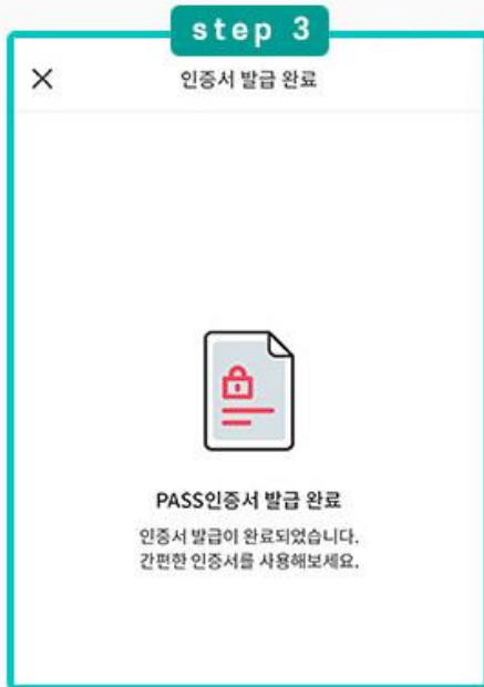
PASS 인증서 발급 완료