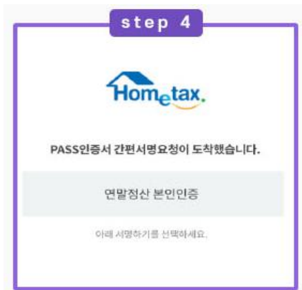
간편 서명 요청